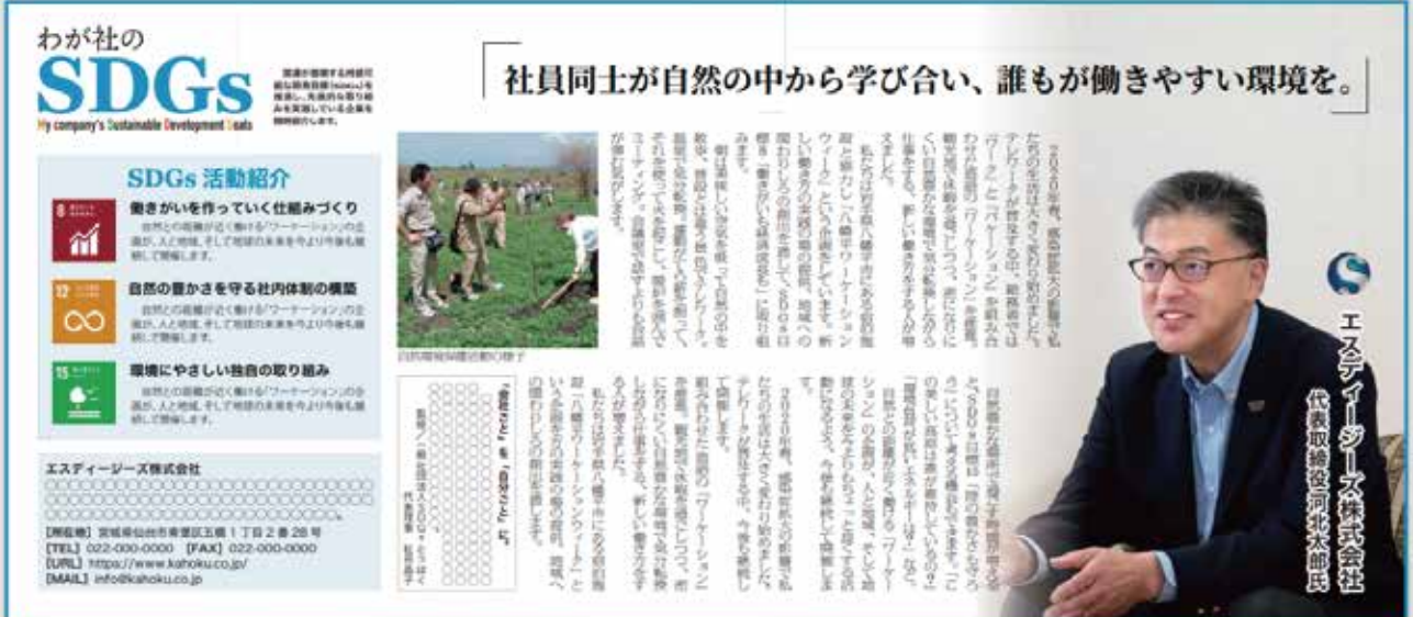
※一般社団法人SDGsとうほくによる社のSDGs活動の監修、本紙面にコメントを掲載することも可能です