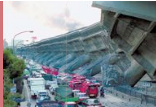
地震で橋を支える柱が折れ、倒れた阪神高速道路