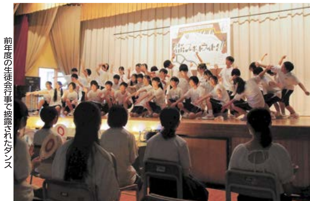
前年度の生徒会行事で披露されたダンス

私たちの学校の生徒会行事、合唱祭、運動会は「三大行事」と呼ばれています。生徒会行事は例年、午前部に修学旅行や野外活動などのまとめの発表や吹奏楽部によるコンサートがあります。前年度は午後の部で有志がダンスや漫才などを披露しました。生徒が主体となってつくり上げ、全校生徒が盛り上がるとても楽しい行事です。